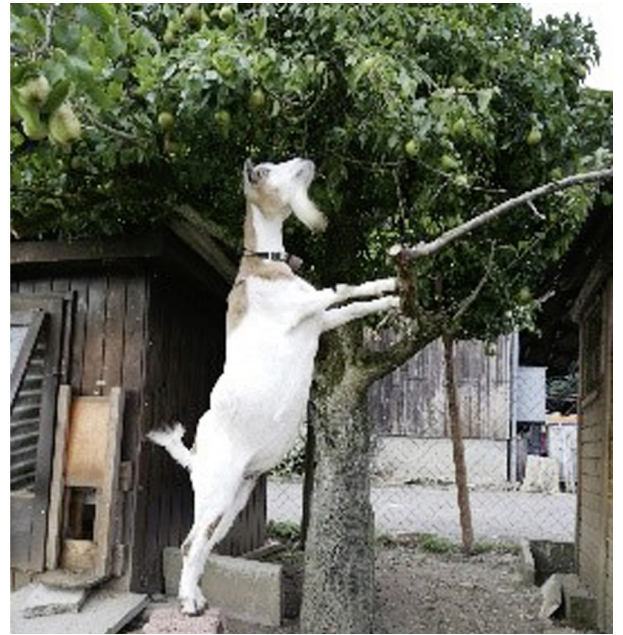
Die Sonderschau der Dübi Mäss widmet sich den Tieren. Unter anderem werden Alpakas zu sehen sein.