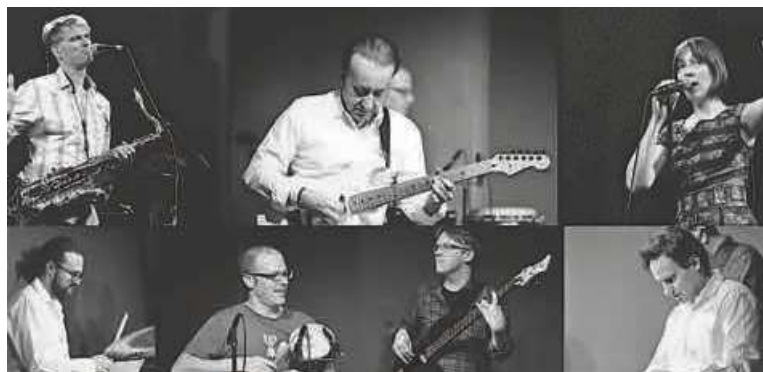
Ein weiterer Teil der Serie «Musig ide Mall» findet mit Enshore statt.

Nach den ersten beiden Durchführungen von «Musig ide Mall» mit Marco Gottardi & The Silver