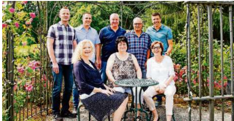
Das Organisationskomitee freut sich auf zahlreiche Besucher im Jahr 2020.

Mit kühlem Kopf wird an den Vorbereitungen der Dübi-Mäss 2020 – des attraktiven Frühlingsevents für Aussteller und die Bevölkerung von und um Dübendorf – gearbeitet. Eine regionale Gewerbeschau der Superlative, die ihresgleichen sucht. Auch 2020 warten wieder viele Attraktionen auf die in den letzten Jahren stets über 20000 Besucherinnen und Besucher. Die Teilnahme an der Dübi-Mäss steht natürlich auch Firmen offen, die nicht Mitglied des Gewerbevereins Dübendorf sind. Die Dübi-Mäss ist ein Treffpunkt für Firmen und Geschäfte zur Pflege von Kundenkontakten, ein Publikumsagnet, der viele bisherige und neue Kunden, aber auch Neugierige anziehen wird. Sie ist eine Plattform, die Ihnen als Aussteller beste Gelegenheit bietet, um Ihre Produkte,